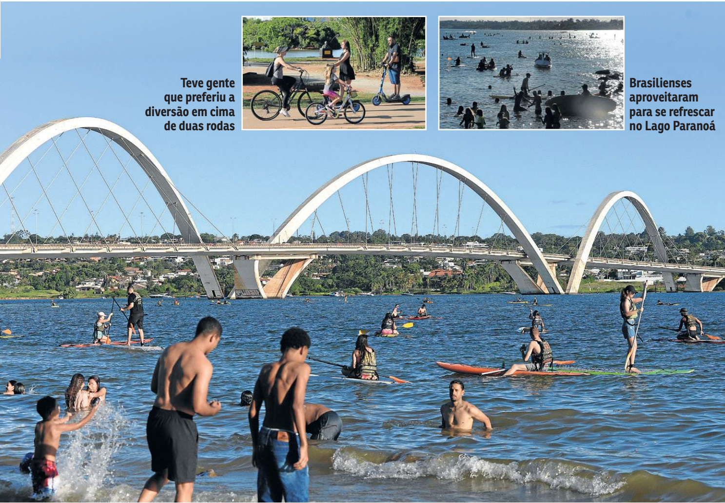
O Lago Paranoá, a praia de Brasília, é um refúgio tradicional para pessoas de todas as idades em dias com temperaturas elevadas

capital o total de 174.2mm. “Não sei se conseguiremos alcançar o esperado”, diz a meteorologista. O Inmet emitiu, ontem, alerta de altas temperaturas para oito estados: São Paulo, Rio de Janeiro, Minas Gerais, Espírito Santo, Goiás, Mato Grosso do Sul, Paraná e Santa Catarina. O alerta vermelho, válido até segunda-feira, é o maior grau entre os três avisos emitidos pelo instituto.