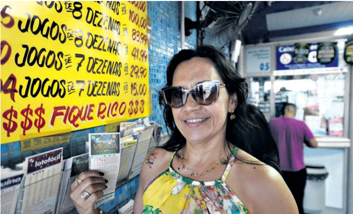
Lourdimar sonha em ajudar as crianças de sua cidade natal