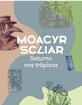
COMPANHIA DAS LETRAS

Antiguidade, Renascença e o nascimento do Brasil moderno se cruzam nessa narrativa que propõe contar a história da melancolia e como esse sentimento atravessou eras e se tornou parte fundamental da construção da modernidade.