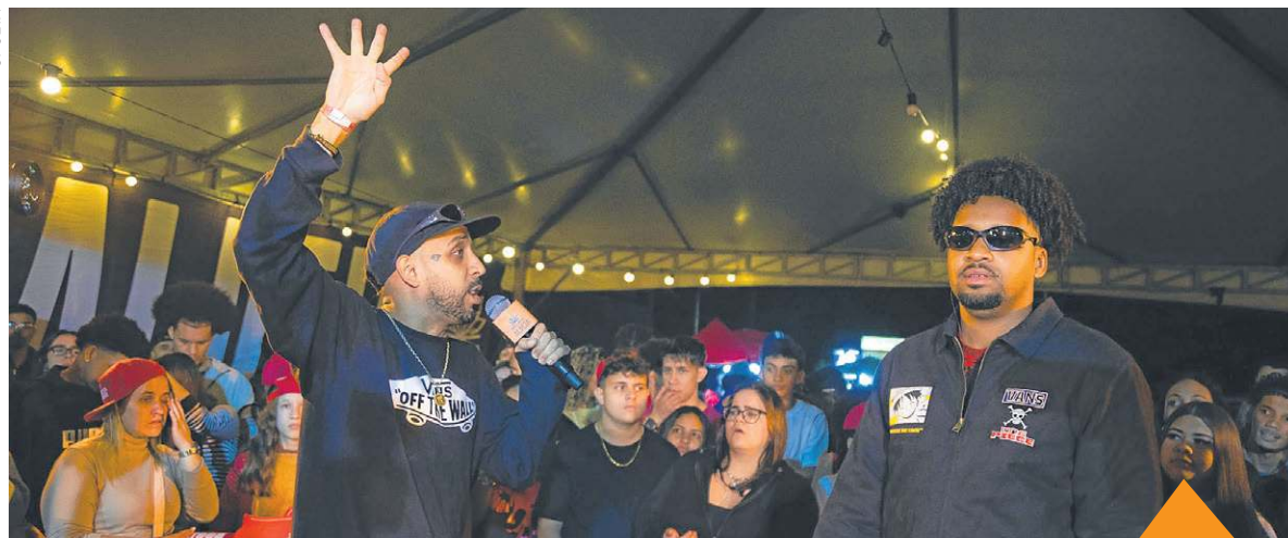
A Batalha da Aldeia chega com o embate da poesia em forma de rap. AGITE, PÁGINA 26