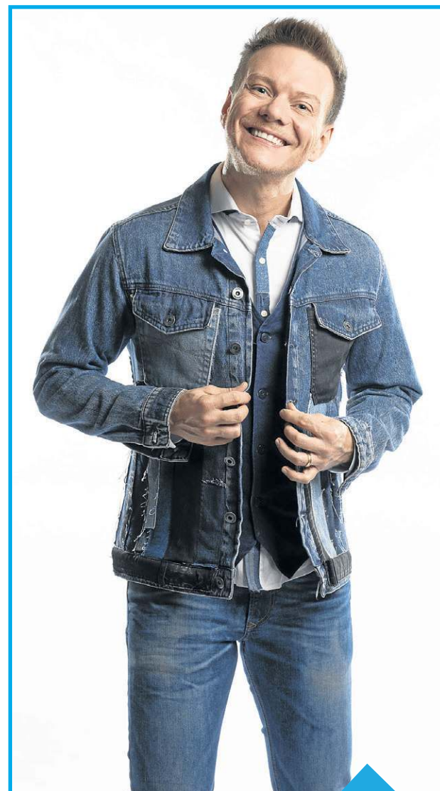
Michel Teló faz show gratuito na Esplanada dos Ministérios. MÚSICA, PÁGINA 15