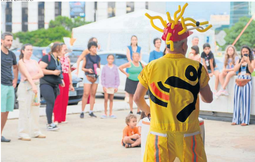
Estação Natal oferece programação para crianças e adultos