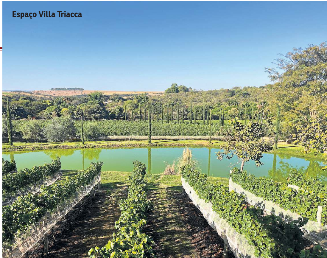
Espaço Villa Triacca