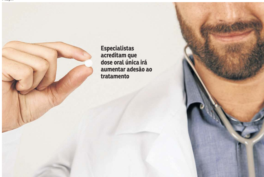
Especialistas acreditam que dose oral única irá aumentar adesão ao tratamento

ou o tratamento padrão. Os resultados evidenciaram que a zoliflodacina curou mais de 90% das infecções na região genital. O medicamento foi bem tolerado, com efeitos colaterais semelhantes aos observados na abordagem atual, e nenhum problema grave de segurança foi relatado.