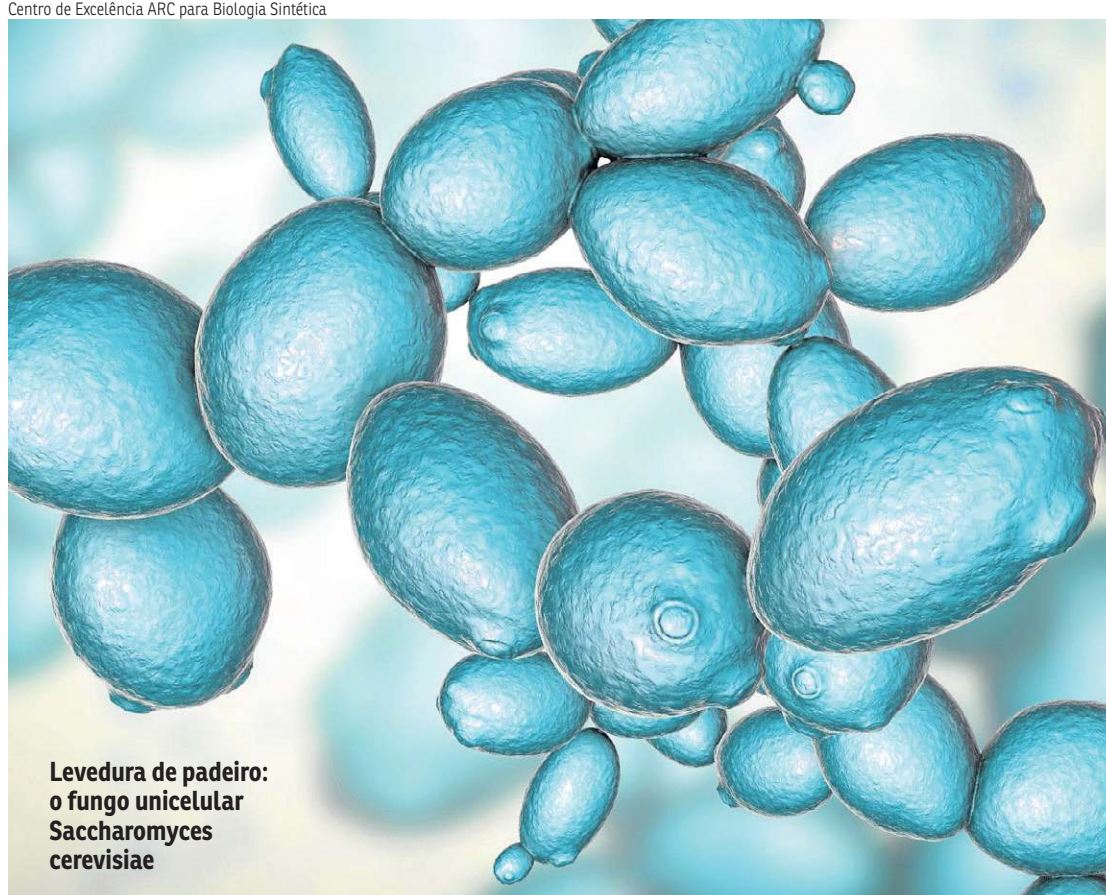
Levedura de padeiro: o fungo unicelular Saccharomyces cerevisiae

Diferente da engenharia genética tradicional, que modifica genomas existentes, o Sc2.0 foi o primeiro a reescrever o material inteiro do zero, considerando os 12 milhões de pares de bases do DNA. “Concluir todos os 16 cromossomos sintéticos