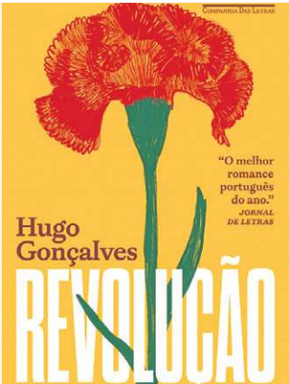
COMPANHIA DAS LETRAS

O destino de uma família é atravessado pela revolução e pelo despedaçamento que vem junto com uma ditadura. A narrativa acompanha a trajetória dos Storms, cujo futuro está condicionado às consequências do regime militar de Salazar.