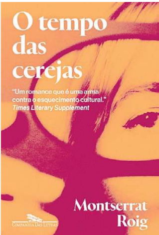
COMPANHIA DAS LETRAS

Clássico moderno da literatura catalã, o romance de Roig acompanha a volta de Natàlia a Barcelona após um tempo na França e na Inglaterra. São os últimos anos do regime franquista e novos ares impregnam o cotidiano de uma cidade efervescente.