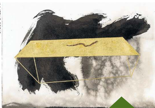
Elder Rocha expõe desenhos e pinturas inéditos na galeria Cerrado Cultural.