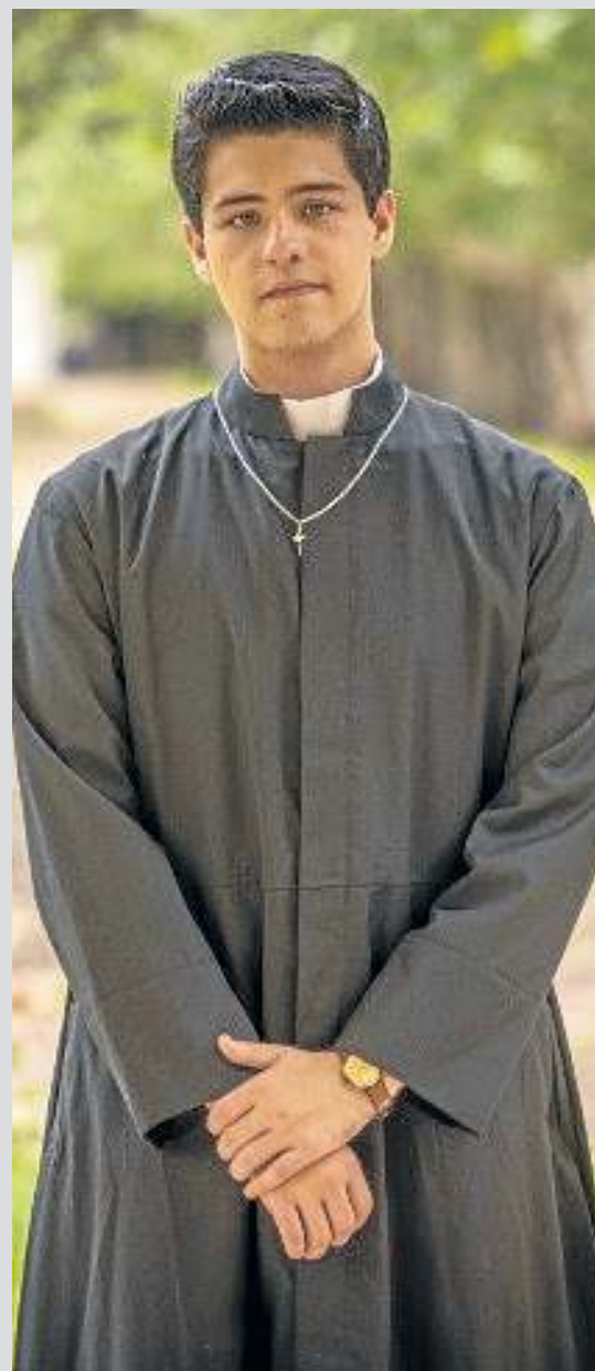
Ele foi o noviço Luís em Amor perfeito