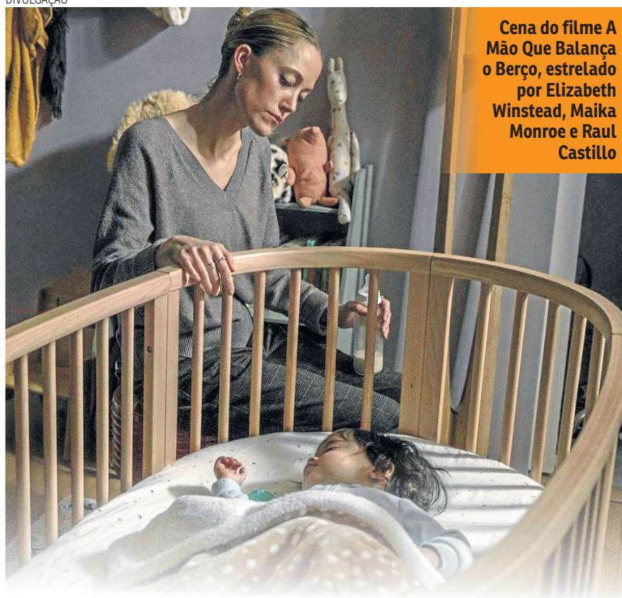
Cena do filme A Mão Que Balança o Berço , estrelado por Elizabeth Winstead, Maika Monroe e Raul Castillo