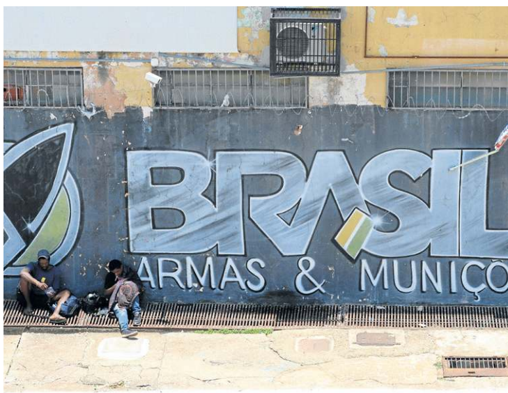
Tráfico e uso de drogas passaram para 380 ocorrências em 2025