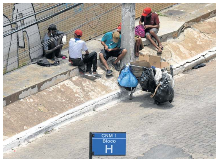
A presença de usuários de drogas preocupa quem circula na região