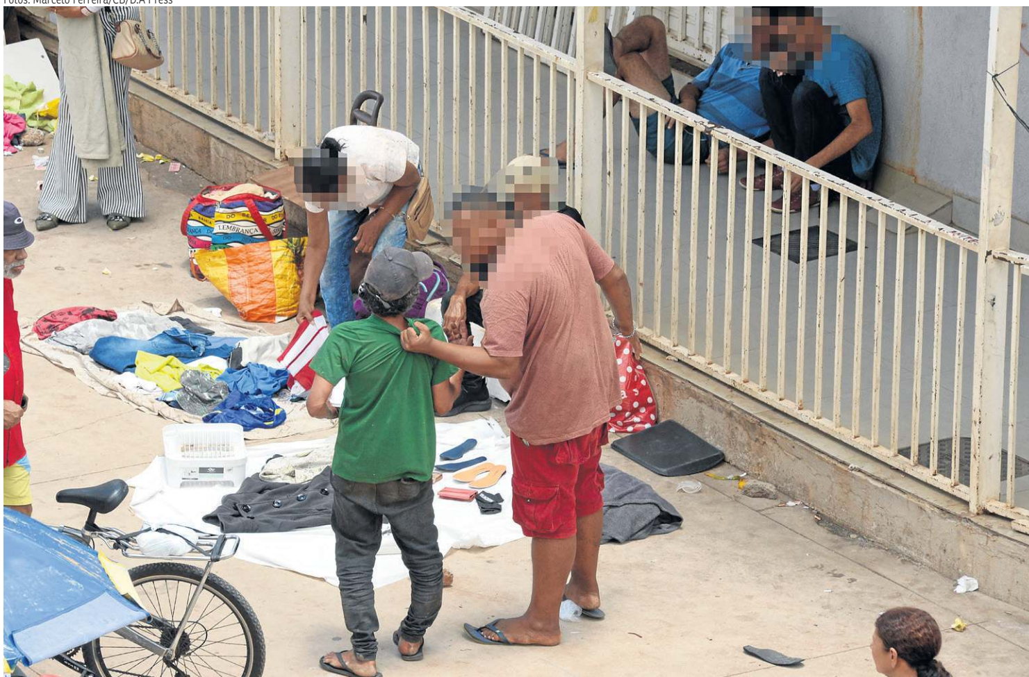
Conflitos entre pessoas em situação de rua são comuns na região; o Correio flagrou uma dessas situações na última sexta-feira