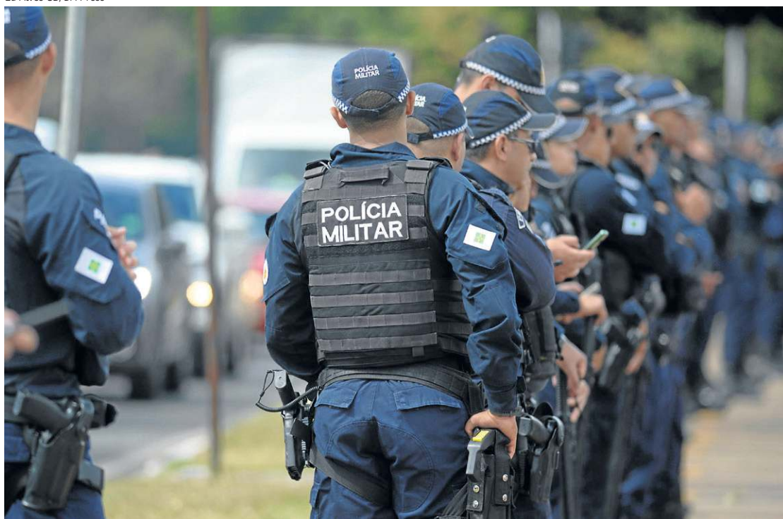
Parceria entre Consegs e a Polícia Militar ajuda a reduzir as criminalidade em várias regiões do DF