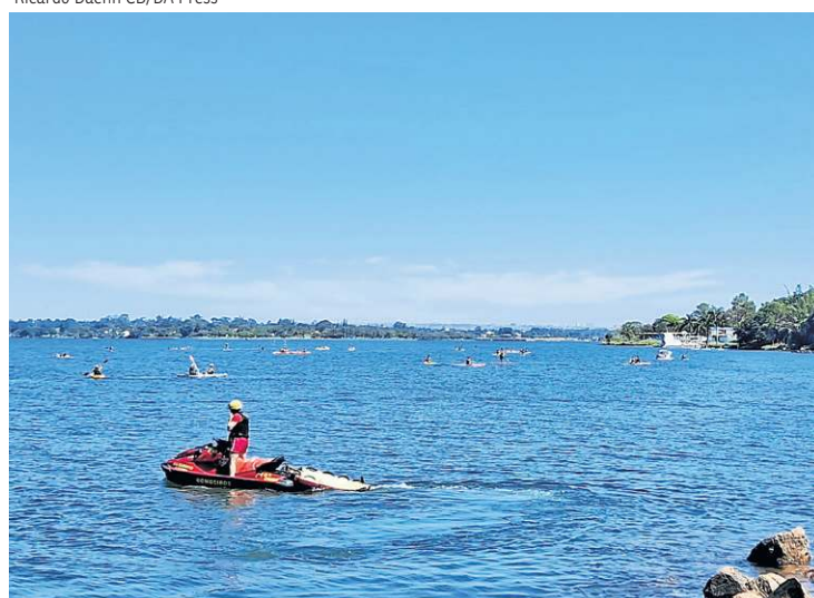
Embarcações rápidas foram implementadas em cinco pontos do lago

a má combinação entre bebida e natação responde por maiores incidentes. “Aqui é diferente de piscina, tem que haver um mínimo de capacidade de natação. Fazer mergulho e esportes, de modo consciente, é vital. As pessoas não devem