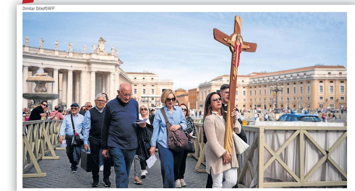
Peregrinos caminham com cruz de madeira pela Praça de São Pedro: penitência, fé e esperança em um novo papa

Por volta das 18h45 de ontem (13h45 em Brasília), foi celebrada a última missa Novemdiales na Basílica de São Pedro, na Cidade do Vaticano. Na homilia, o cardeal