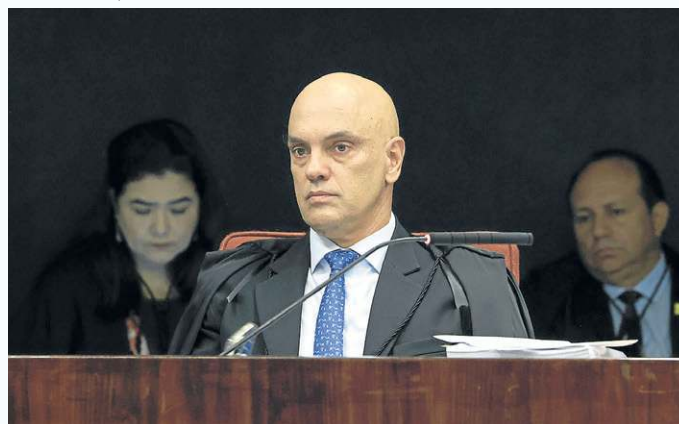
Moraes disse que garantiu aos advogados acesso à denúncia