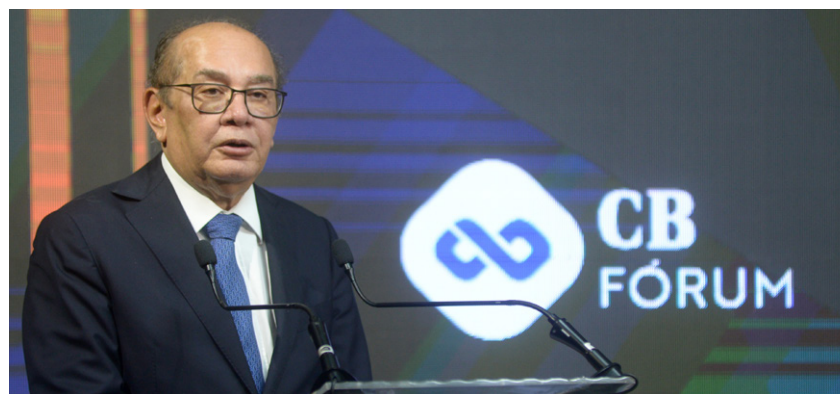
Gilmar Mendes, ministro decano do Supremo

Setor estratégico para a economia nacional, o agronegócio busca mais recursos, principalmente internacionais, mas encontra entraves em dificuldades regulatórias, que acabam provocando insegurança jurídica. O tema foi debatido por autoridades, empresários e especialistas no CB Fórum: Cenário dos Investimentos Estrangeiros no Agronegócio Brasileiro , promovido ontem pelo Correio . A questão da regulamentação do uso de terras nacionais por produtores de outros países é considerada ponto-chave para acelerar o desenvolvimento do setor. Convidado para o encerramento, o ministro decano do STF Gilmar Mendes, destacou a potencialidade do agro e a importância de uma agenda sustentável. "É preciso buscar equilíbrio entre a economia, o bem-estar social e o meio ambiente", discursou o magistrado.