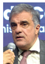
José Eduardo Cardozo