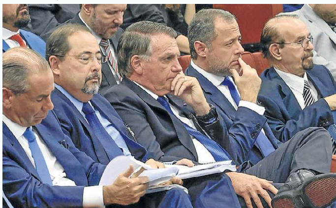
Bolsonaro surpreendeu ao acompanhar a sessão no STF