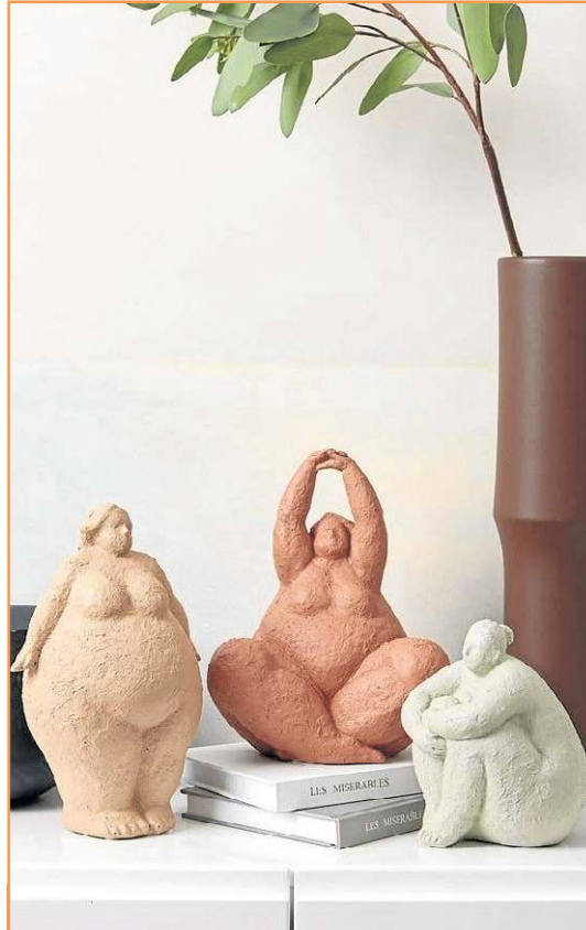
É possível incluir esculturas, vasos, prateleiras com objetos decorativos ou até tapeçaria