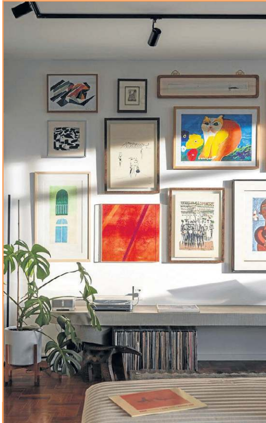
Quadros são essenciais para a montagem de uma galeria de arte em casa: não se esqueça da iluminação focal