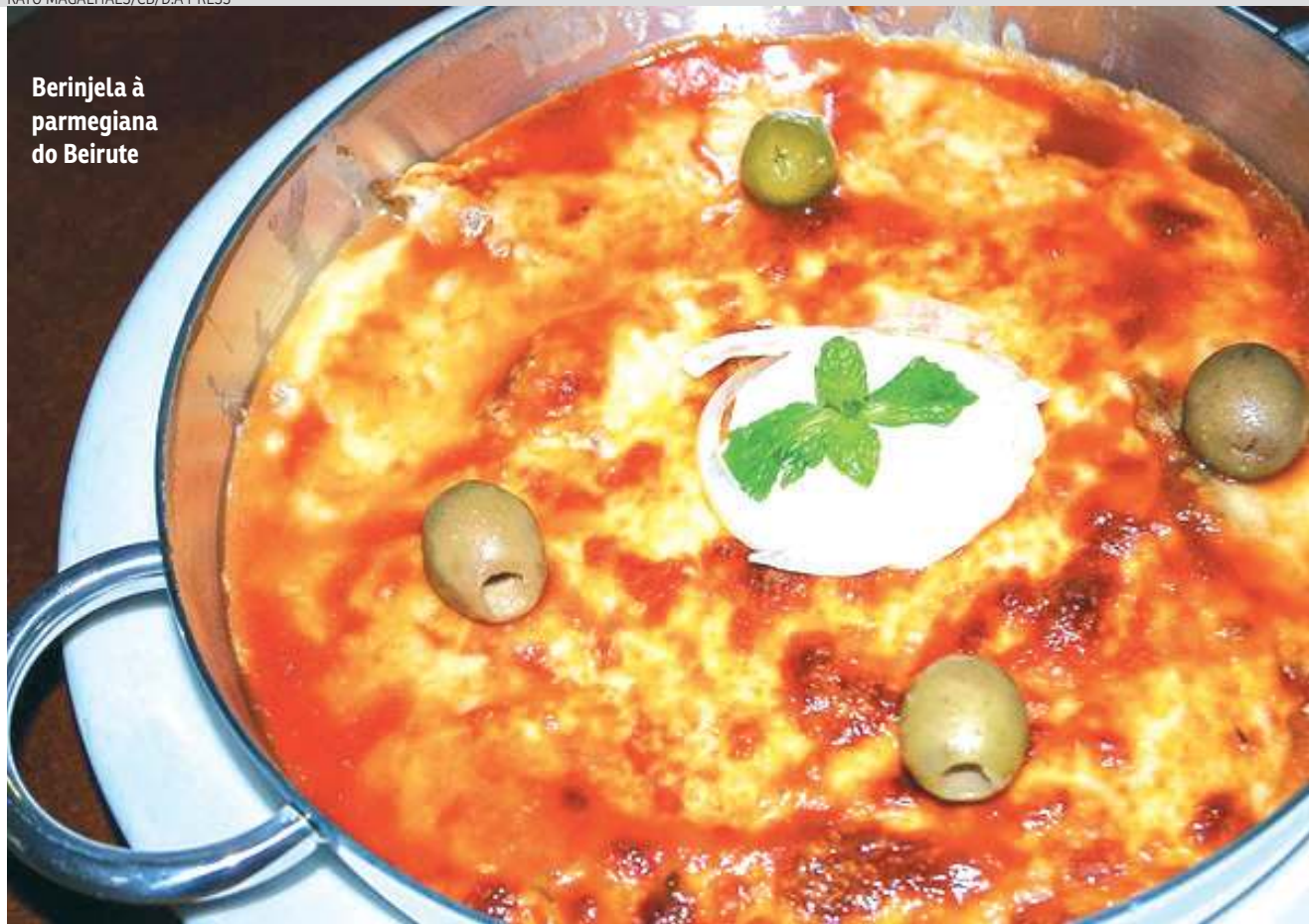
Berinjela à parmegiana do Beirut

Restaurantes clássicos da cidade também se adaptaram à dieta vegetarianana. O Bar Beirut, por exemplo, tradição brasiliense há quase seis décadas, oferece no menu uma versão sem carne de alguns dos pratos mais amados da casa. De entrada, a opção ideal é o kibeirute de berinjela (R$ 42,70), com tabule e coalhada temperada, e, nos pratos principais, o destaque vai para a berinjela à parmegiana (R$ 89,90). Para acompanhar, a sugestão é uma boa cerveja — bebida mais popular entre os clientes do restaurante. No cardápio, são seis diferentes rótulos, que variam entre R$ 10,90 e R$ 21,50, além do chope Brahma (R$ 9,99).