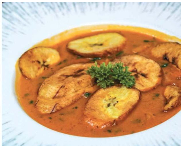
Moqueca de banana do Ouriço