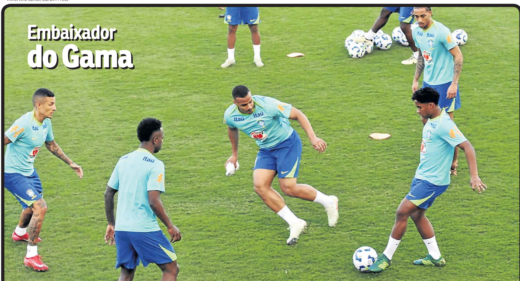
Minervino Júnior/CB/D.A Press