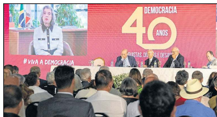
Seminário ocorreu no Panteão da Pátria e da Liberdade

Reunidos na Praça dos Três Poderes, autoridades, acadêmicos e ex-chefes de Estado celebraram os 40 anos de redemocratização do Brasil com os olhos voltados para a manutenção da estabilidade política no país. "Nossa democracia amadureceu, mas precisa ser protegida. Devemos continuar a exigir a profundidade do processo democrático e garantir que ele nunca seja interrompido. O preço da liberdade é a eterna vigilância", disse José Sarney, o primeiro a assumir a Presidência da República após os 21 anos de ditadura militar. Convidados do evento apoiado pelo Correio também indicaram a garantia da equidade de gênero, a redução das desigualdades e o combate ao ódio político como condições indispensáveis para evitar novos retrocessos.