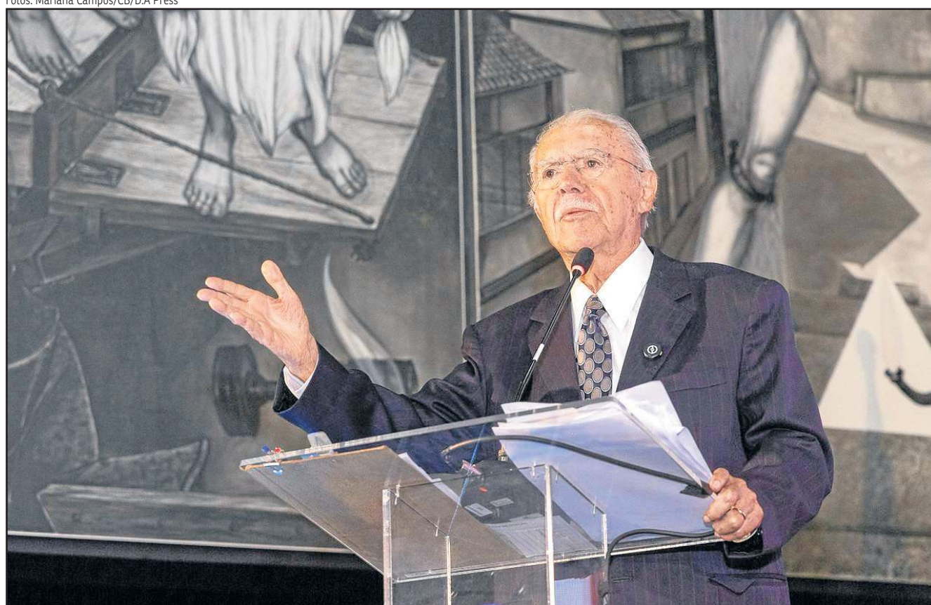
No discurso, Sarney enfatizou, ainda, a importância da Constituição de 1988 e da cooperação entre civis e militares

Reunidos na Praça dos Três Poderes, autoridades, acadêmicos e ex-chefes de Estado celebraram os 40 anos de redemocratização do Brasil com os olhos voltados para a manutenção da estabilidade política no país. "Nossa democracia amadureceu, mas precisa ser protegida. Devemos continuar a exigir a profundidade do processo democrático e garantir que ele nunca seja interrompido. O preço da liberdade é a eterna vigilância", disse José Sarney, o primeiro a assumir a Presidência da República após os 21 anos de ditadura militar. Convidados do evento apoiado pelo Correio também indicaram a garantia da equidade de gênero, a redução das desigualdades e o combate ao ódio político como condições indispensáveis para evitar novos retrocessos.