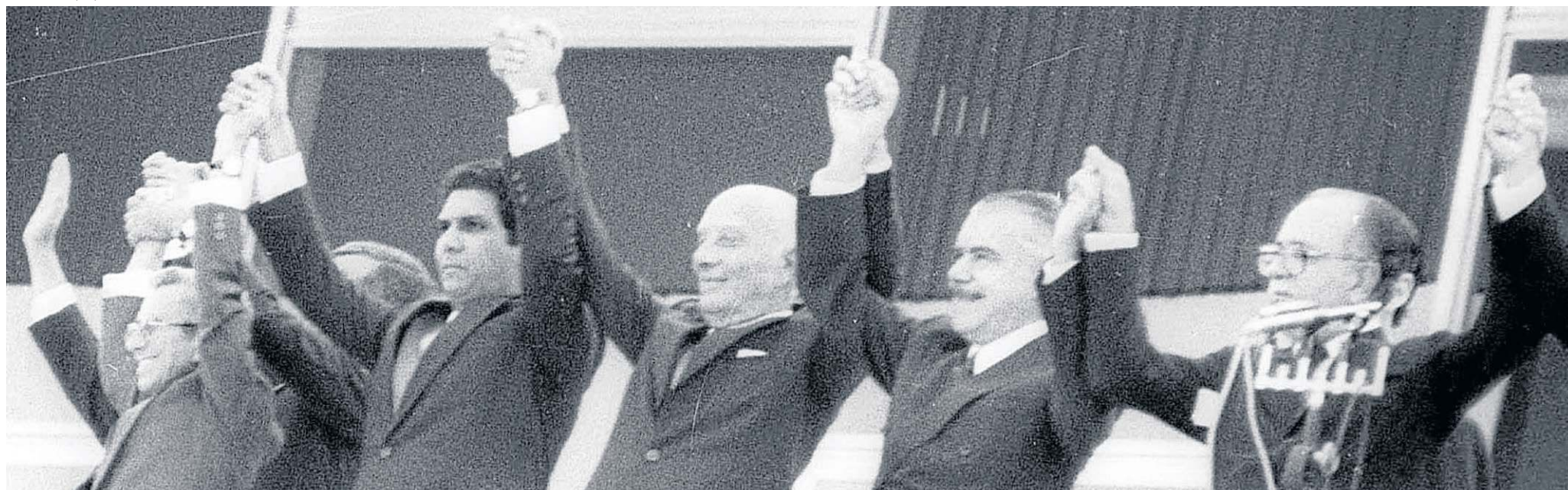
José Sarney, de mãos dadas com Ulysses Guimarães e com o então ministro de Cultura José Aparecido, saúdam os brasileiros em frente ao Palácio do Planalto em 15 de março de 1985