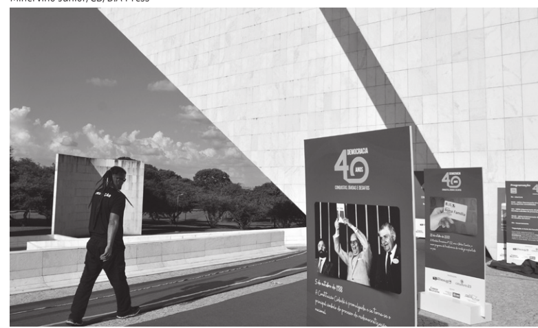
Exposição de fotos do Correio celebra a redemocratização no Panteão

PÁGINAS 2, 3, 17 E 18. VISÃO DO CORREIO, 10, E BRASÍLIA-DF, 5