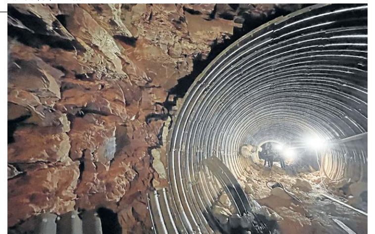
Nesta etapa, estão sendo montadas as chapas metálicas