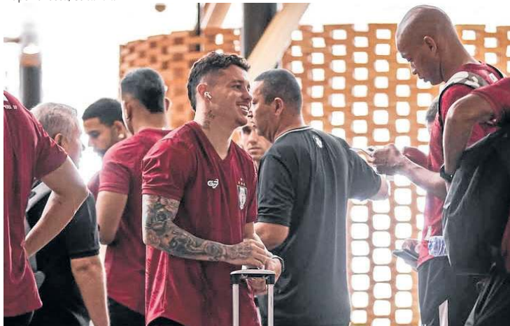
Elenco do Ceilândia viajou ontem para enfrentar o Maracanã no Ceará

nal no currículo da competição nacional. As melhores campanhas do Gama no torneio são as participações nas oitavas de final das temporadas de 2004 e 2007. O Ceilândia tem uma terceira fase com destaque, enquanto o Capital participa pela primeira vez.