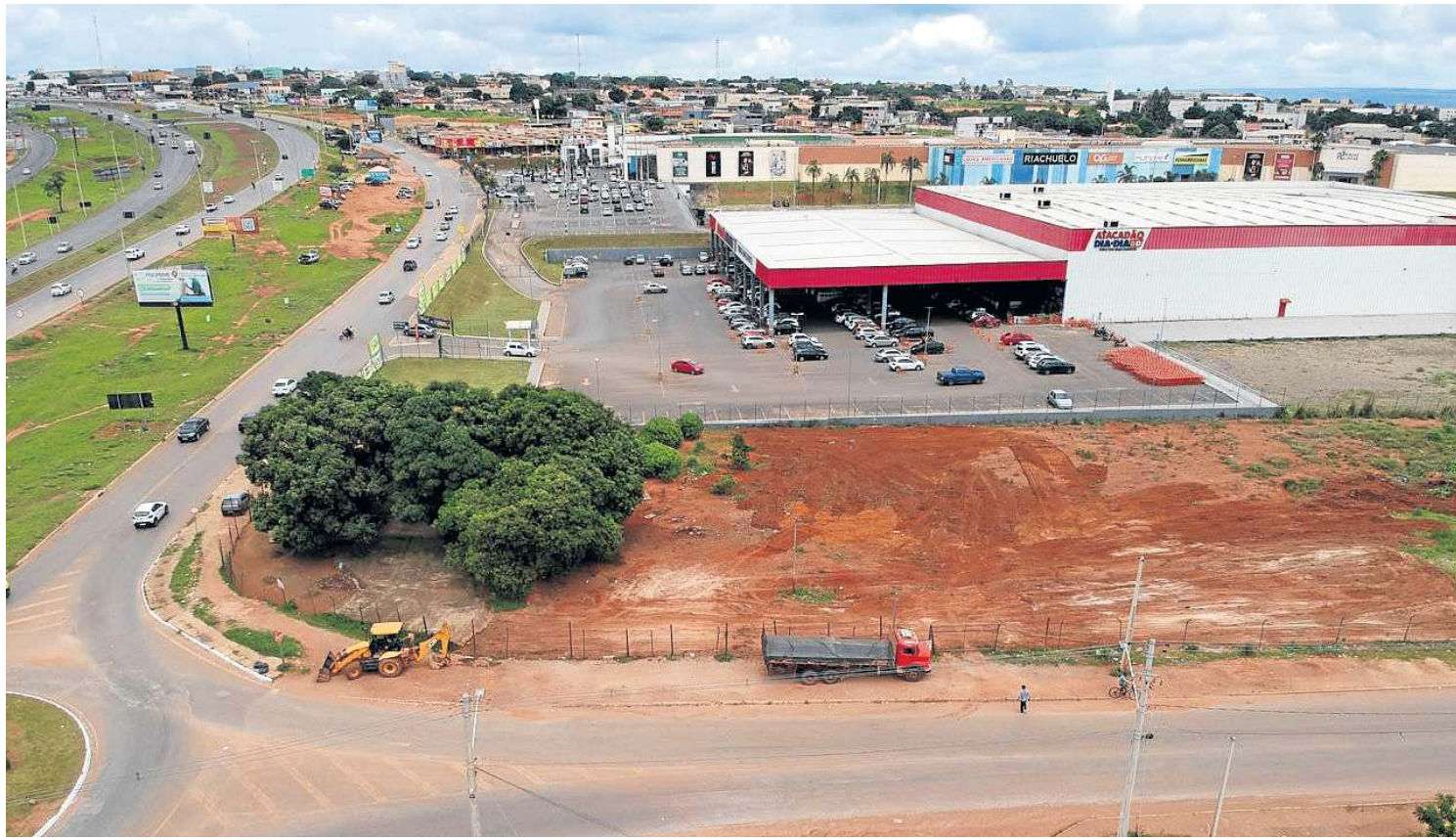
Terreno onde será construído o Itec — pavilhão de exposições permanente com área de 8.600m², ao lado do Shopping de Águas Lindas