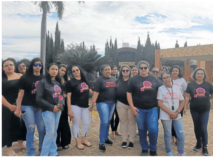
Coletivo de condutoras: elas se sentem inseguras e desamparadas

52, estava abalada com a partida de alguém que, garantiu, amava. Ela reclamou que o medo e a insegurança acompanham a todas as mulheres que se arriscam em ser motoristas de aplicativo.