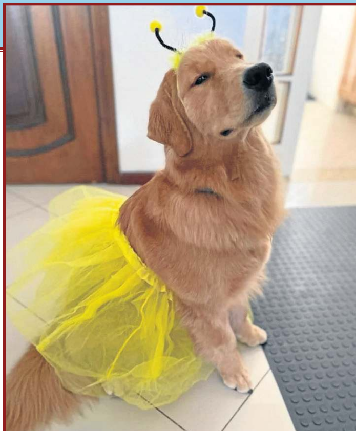
As fantasias devem ter tecidos leves e confortáveis.

*Estagiária sob a supervisão de Sibelegromonte