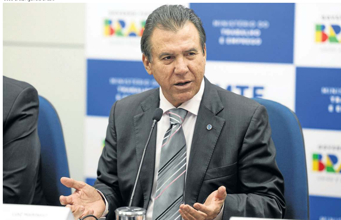
Ao divulgar dados do Caged, Marinho informou que MP vai escalonar saque do FGTS por mês de aniversário