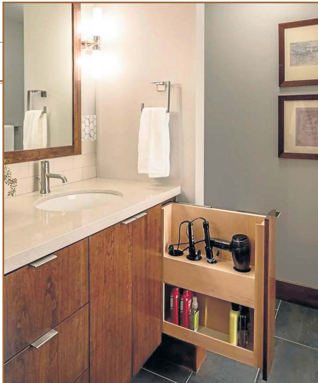
Os planejados são mais úteis e versáteis: gavetas embutidas são uma boa solução para o banheiro