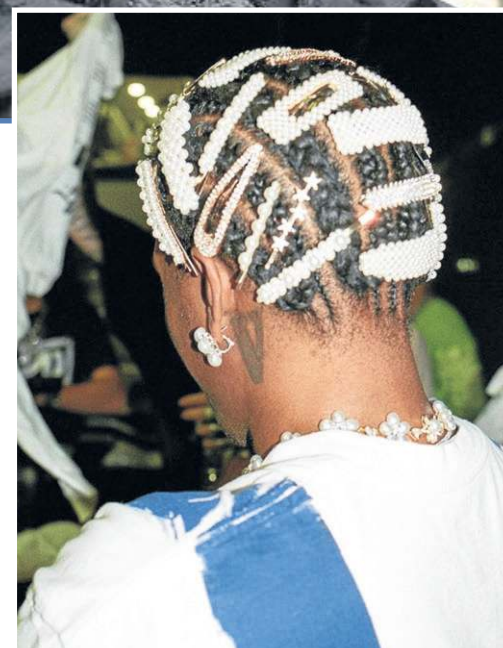
O rapper A$AP Rocky usa pérolas até no cabelo

dessa tendência foi o cantor Harry Styles. “Ele usou um sutil brinco de pérolas de água doce no Baile do MET Gala em 2019 e, desde então, o uso de pérolas por homens em eventos e tapetes vermelhos se tornou mais frequente.”