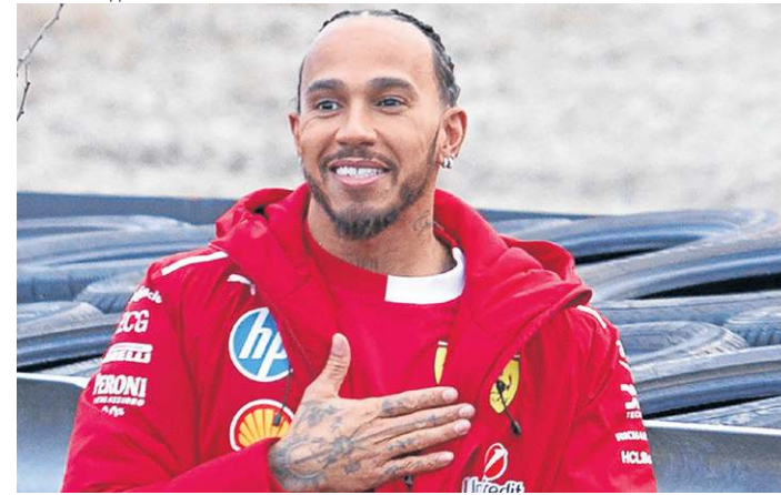
Piloto inglês vive os primeiros dias vestindo o macacão vermelho

O piloto britânico Lewis Hamilton, heptacampeão mundial, deu, na quarta-feira, as primeiras voltas numa pista com o novo carro da Ferrari (SF-2025) e admitiu estar nas nuvens por ter se juntado à equipe com que sempre sonhou.