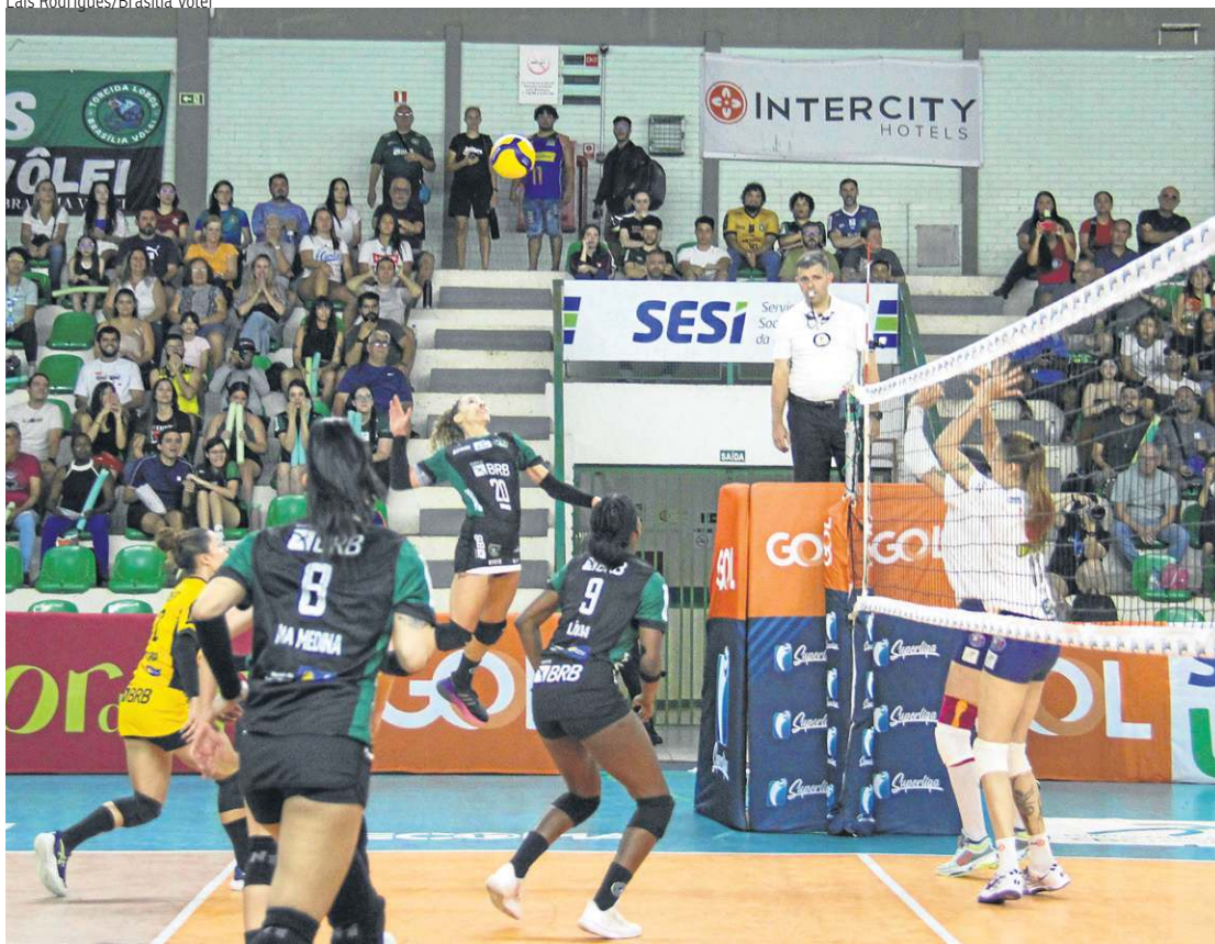
Time brasiliense até tentou, mas não se impôs contra o Barueri e se distanciou da zona de classificação