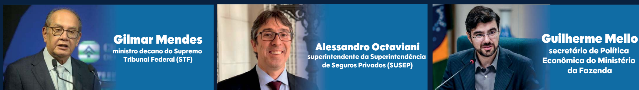
Gilmar Mendes ministro decano do Supremo Tribunal Federal (STF)