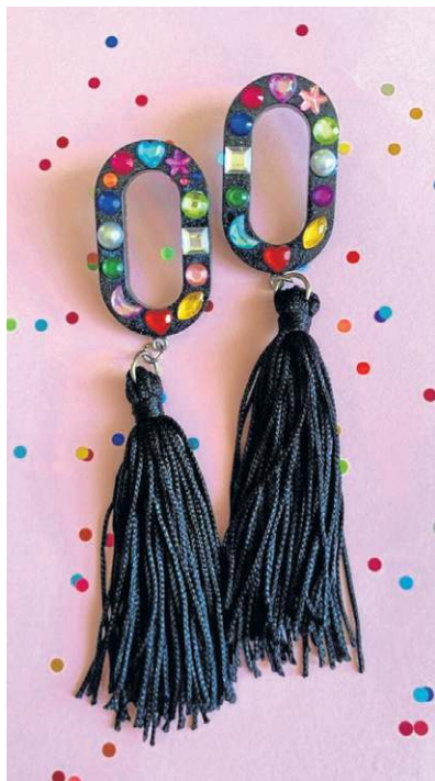
Brinco Gems, da Let's Dance, disponível na Endossa (R$ 52)