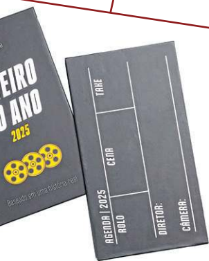
Agenda 2025 Claquete Roteiro do Ano, da Imaginarium (R$ 99,90)