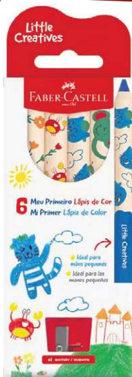
Meu Primeiro Lápis de Cor – Little Creatives, da Faber-Castell (R$ 21,40)