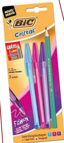
Kit Canetas Fashion com 4, da BIC, nas Americanas (R$ 6,99)