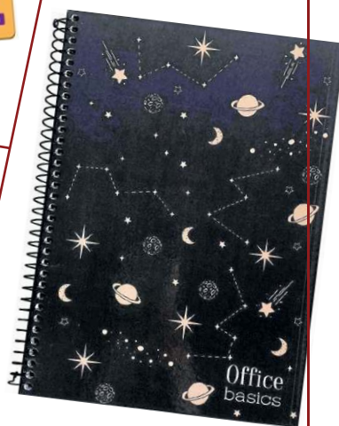
Caderno 10 Matérias School Basics, nas Americanas (R$ 16,99)