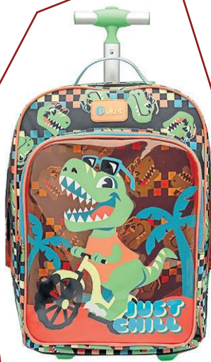
Mochila com Rodinha Dino Miami, da Puket (R$ 749,90)