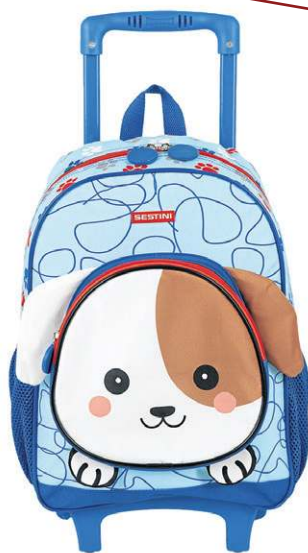
Mochila de Rodinhas Média Kids Dog, da Sestini (R$ 199,90)