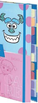
Fichário universitário Monstros S.a X, da Disney, no Mercado Livre (R$ 128,49)