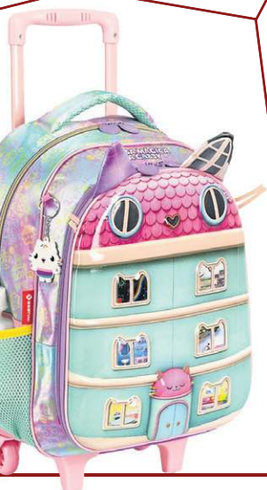
Mochila de Rodinhas Gabby Party Room, da Sestini (R$ 479,90)