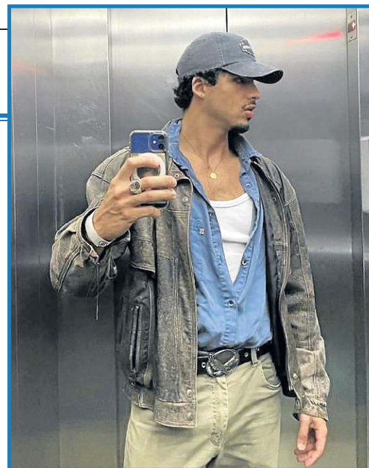
Sobreposições com o tão amado boné são bem-vindas