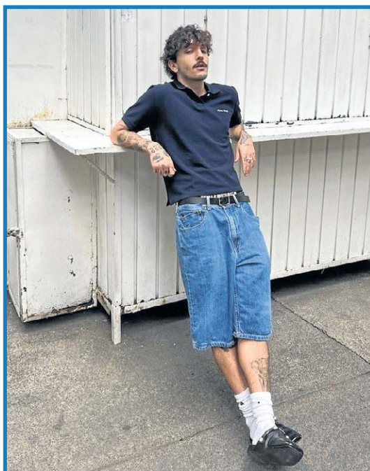
Bermuda com camisa polo é o equilíbrio entre o social e o formal