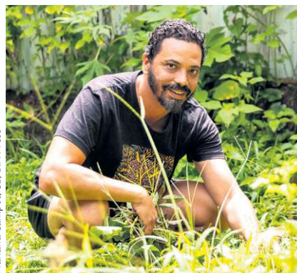
Mariana Campos/CB/D.A. Press