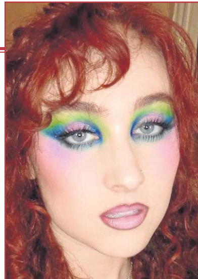
A cantora Chappell Roan é uma das percussoras do estilo New Wave atual