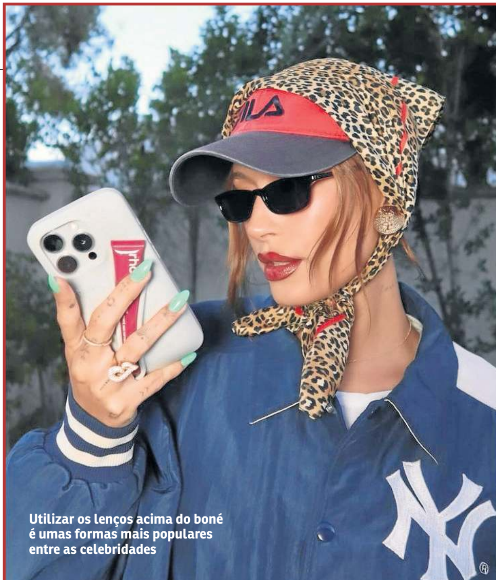
Utilizar os lenços acima do boné é umas formas mais populares entre as celebridades