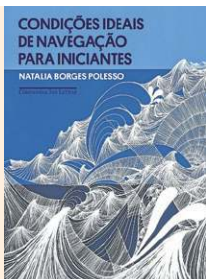
COMPANHIA DAS LETRAS

Em um retorno ao conto, gênero com o qual ganhou destaque na cena literária, e após dois romances, a autora introduz personagens que expõem temáticas como a vivência LGBTQIA+, a neurodivergência e o desafio de escrever em linguagem neutra.