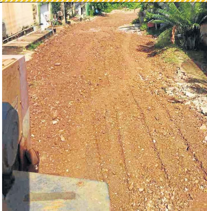
Adm. Reg. São Sebastião

» De acordo com a Administração Regional de São Sebastião, a rua citada pelo morador está recebendo manutenção viária, periodicamente. O órgão enviou uma foto do local. "Segue, anexa, imagem dessa quinta-feira (9/1), reforçando o compromisso de atender às necessidades da região, especialmente diante dos impactos causados pelas fortes chuvas". A administração não deu previsão sobre asfaltamento para a rua.