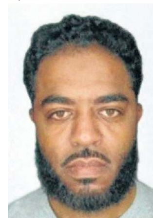
Shamsud Din Jabbar, 42 anos, autor do ataque, foi abatido a tiros