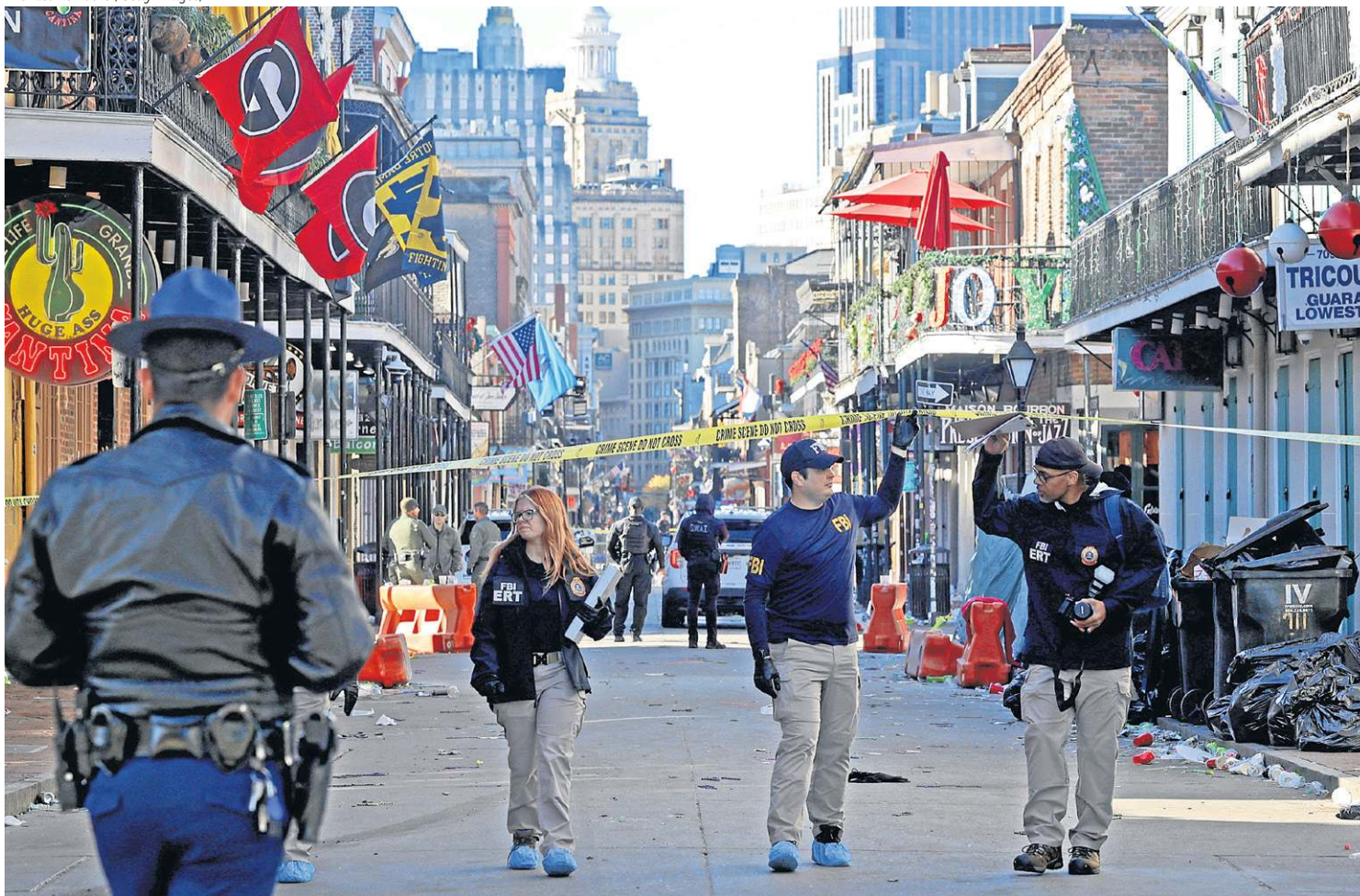
Policiais e agentes do FBI caminham pela Bourbon Street, o local do atentado, no coração do French Quarter: madrugada de horror

de prevenir mais mortes. “Não há justificativa para a violência de nenhum tipo e não toleraremos nenhum ataque contra nenhuma das comunidades de nossa nação”, reagiu. À noite, fez um discurso à nação, em Camp David (Maryland), no qual afirmou que os investigadores apuram se há conexões entre os incidentes em Nova Orleans e em Las Vegas.