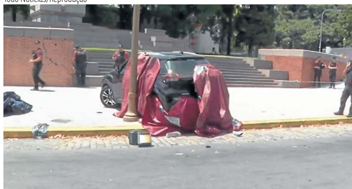
Imagem do local do acidente que vitimou o casal de turistas de São Paulo