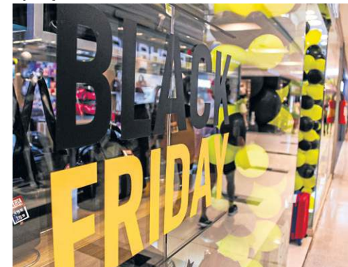
Kayo Magalhães/CB/D.A. Press