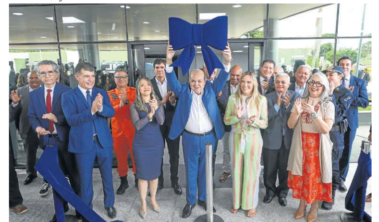
Prédio tem 12 mil m 2 de área construída, com três pavimentos

tecnologia de DNA rápido possibilita a obtenção de resultados em apenas uma hora e meia, em casos específicos, dobrando a