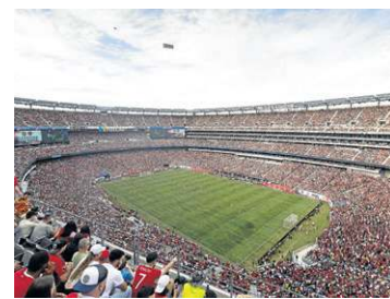
Nova York/Nova Jersey (Estádio MetLife)