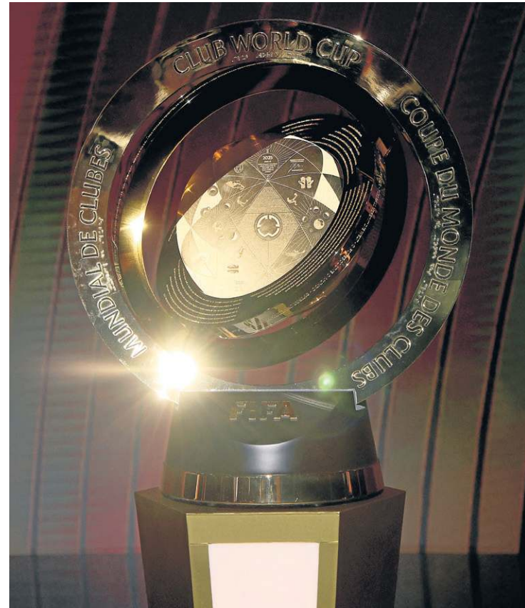
O novo troféu do Mundial, com os nomes dos 211 países filiados à Fifa

Novo troféu apresentado, bolinhas reviradas e grupos formados. O mais novo badalado torneio do calendário tomou forma. O Mundial de Clubes como conhecíamos não existe mais. A competição passou por uma severa atualização e se tornou uma verdadeira Copa do Mundo entre 19 países e seis confederações dos seis continentes da Família Fifa. Os caminhos da primeira edição com 32 clubes estão traçados, com quatro brasileiros envolvidos.