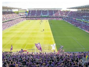
Orlando (Estádio Inter&Co e Estádio Camping World)