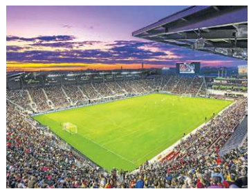
Washington DC (Audi Field)