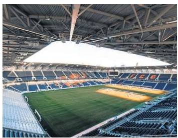
Cincinnati (Estádio TQL)