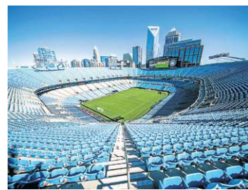
Charlotte (Estádio Bank of America)