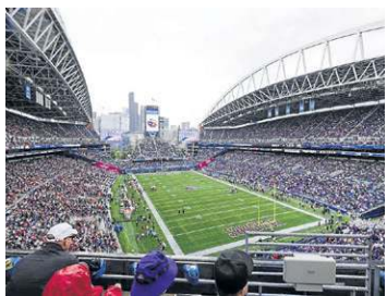
Seattle (Lumen Field)