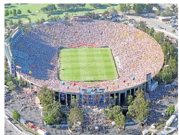
Los Angeles (Estádio Rose Bowl)