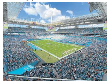
Miami (Estádio Hard Rock)