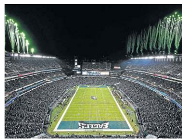
Filadélfia (Lincoln Financial Field)