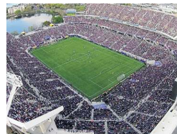
Nashville (GEODIS Park)