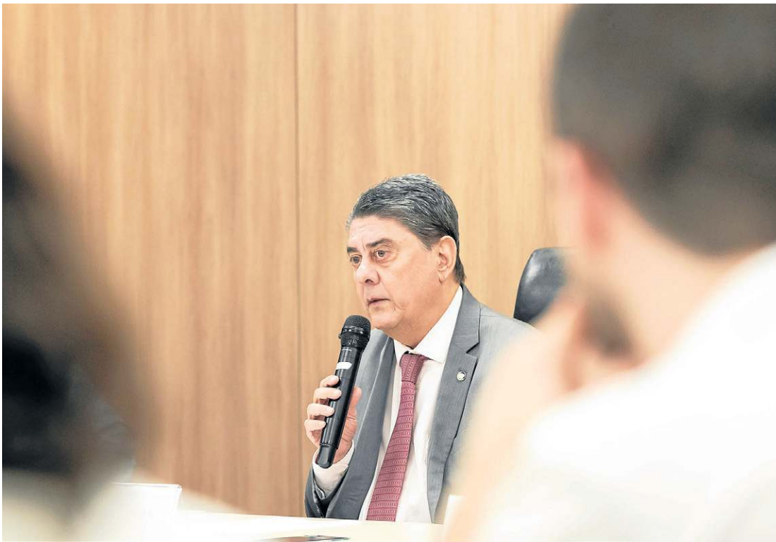
Secretário do Consumidor alerta para os cuidados a serem tomados para evitar golpes na Black Friday

monitorando o mercado durante a Black Friday para coibir práticas enganosas e garantir o acesso ao consumo consciente e seguro.