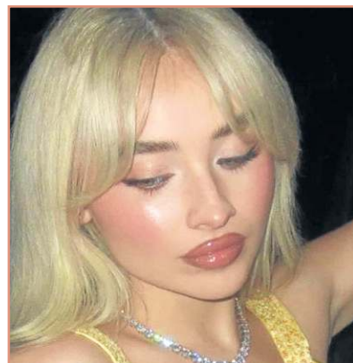
O uso de gloss é uma boa opção para reforçar o brilho da make.