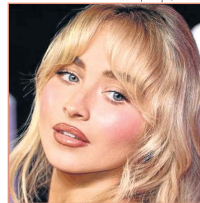
O blush rosado e a boca bem contornada são marcas registradas da estrela