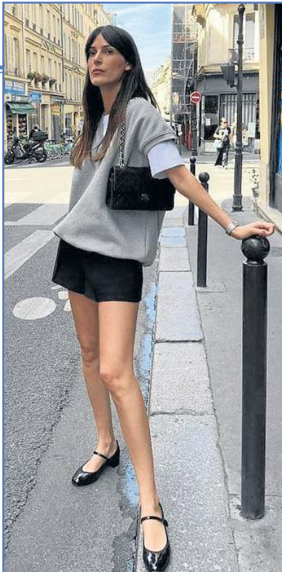
Elas combinam com looks clássicos e modernos