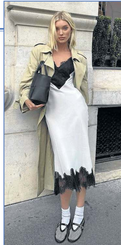
Sapatilha de tela promete dividir opiniões