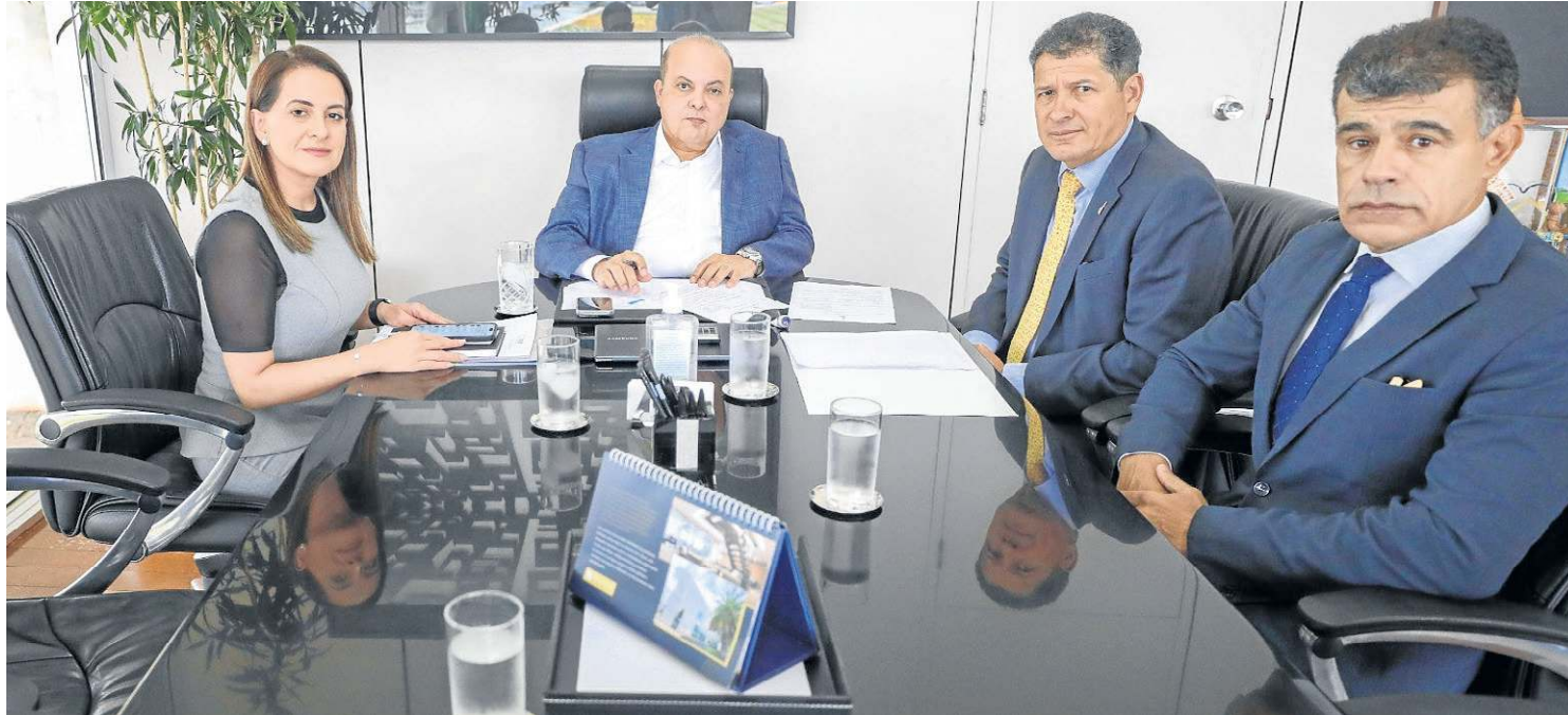
Governador sobre a assinatura do decreto: "Os tempos estão muito difíceis"