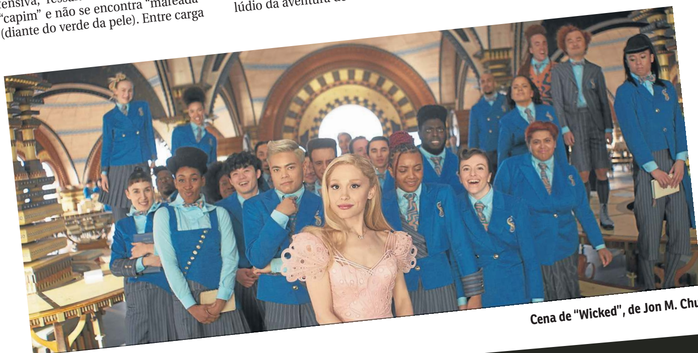
Cena de "Wicked", de Jon M. Chu.

Sapatos feitos de joias, a disposição de uma entusiasmada tutora (Madame Morrible, vivida por Michelle Yeoh) para os truques da varinha de treino (de magia) e o descontrole no comando do centro acadêmico de Shiz têm tudo para desafiar o rumo do Relógio do Dragão do Tempo, famoso pela capacidade de previsões, dentro da inventiva trama administrada por L. Frank Baum (no texto de 1900, O maravilhoso Mágico de Oz ). Wicked , entre outros acertos, traz a capacidade de protesto frente a animais silenciados (sim, na trama eles gozam da capacidade de fala) e ainda a presença de Marissa Bode (atriz cadeirante), no papel de Nessarose (a irmã de Elphaba). Já são pistas para a esperada celebração "para além do arco-íris".