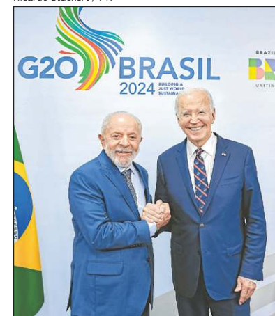
Ricardo Stuckert / PR