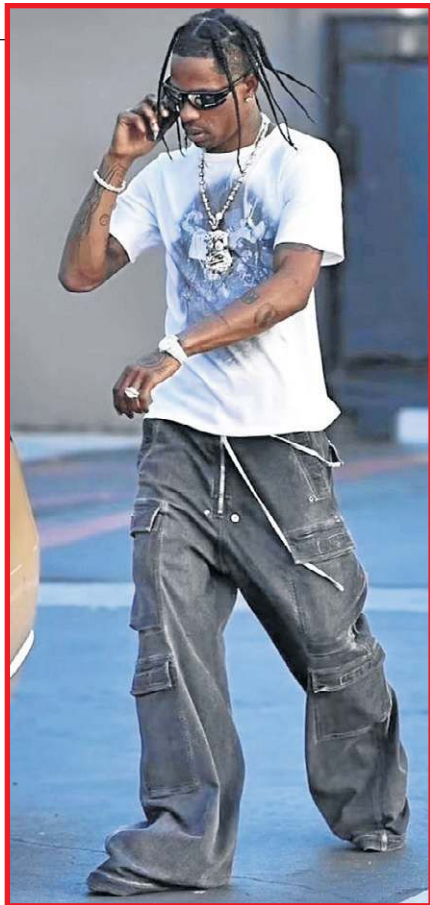
Travis Scott é adepto das correntes e das roupas oversized