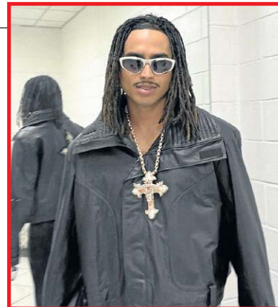
No Brasil, Matuê possui um estilo típico do universo do rap

*Estagiária sob a supervisão de Sibelegromonte