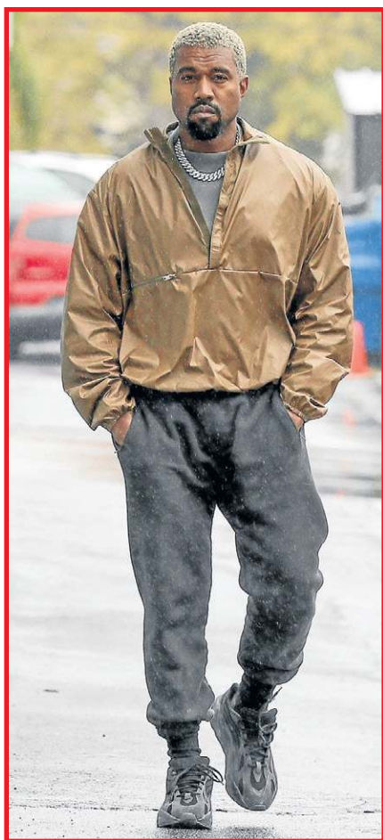
Dono de sua própria marca, a Yeezy, Kanye West é um dos músicos mais influentes no universo da moda

leggings ou shorts curtos são recorrentes, especialmente no estilo rapper clássico dos anos 1990. “Hoje, muitas mulheres adotam o estilo oversized por completo, usando bermudões jeans e camisetas largas”, completa.