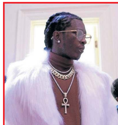
As correntes e acessórios brilhantes estão sempre presentes nos visuais do rapper americano Young Thug

Um dos nomes mais influentes nessa nova vertente é Tyler, The Creator. Conhecido por suas roupas coloridas em tons pastel, estampas animal print, peças vintage e loafers, Tyler se destaca no cenário, contrastando com o visual típico de muitos rappers. Ele criou, inclusive, sua própria marca de roupas, a Golf le Fleur, que traduz sua identidade e seu estilo únicos.